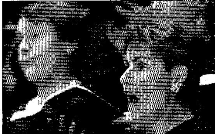
Une interprétation qui fera référence.

L'Orchestre de chambre de Neuchâtel a été partenaire de cette interprétation qui fera référence. /DDC